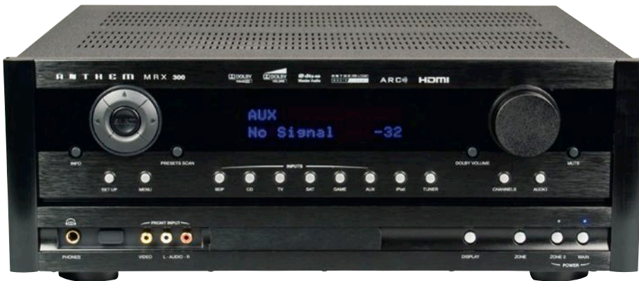
MRX-300 z wyglądu przypomina dalekowschodnie amplitunery sprzed dekady.

Główną atrakcją MRX-300 jest system Anthem Room Correction (ARC), służący do automatycznego ustawiania parametrów sygnału z uwzględnieniem warunków akustycznych pomieszczenia. Własne systemy automatycznego setupu, składające się zazwyczaj z małego mikrofonu podłączanego do amplitunera, stosują już wszyscy liczący się producenci kina