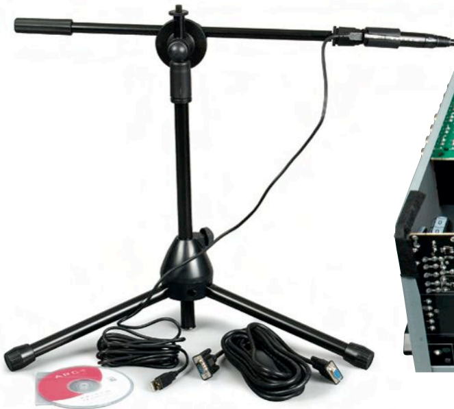
W prezencie System Anthem Room Correction.