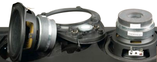
Dwie drogi, trzy głośniki. Ekranowania brak.

Bardzo przyjemne głośniki. Ograniczeniem będą rozmiary pokoju. W małych kłitkach się uduszą. Całe szczęście, w katalogu są jeszcze monitory.