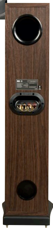
Bas-refleks, profil z gniazdami i zatyczka komory balastowej.

Zwrotnicę przymocowano do profilu z gniazdami. Przyjmą dowolne końców-